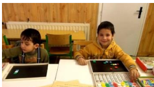
Zápis do 1. ročníku

V úterý 5. února jsme uspořádali zápis do prvního ročníku pro školní rok 2013/2014. Zapsali jsme celkem 37 budoucích prvňáčků. Novinkou letošního zápisu byla účast učitelek mateřské školy, které přišly především „podpořit svoje děti“ a podívat se, jak jim to u zápisu jde.