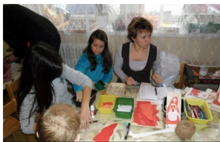
Mikulášská besídka v České besedě