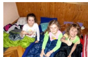
Noc s Andersenem

7. května 2013 se 4 týmy našich atletů (mladší žáci – chlapci a dívky, starší žáci – chlapci a dívky) účastnily atletického čtyřboje v Liberci. Jejich výsledky bohužel nenaplnily naše očekávání a všechny týmy obsadily poslední nebo předposlední místa ve svých kategoriích. Snad to příště bude o něco lepší.