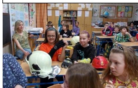
Ukázka práce hasičů

24. dubna 2013 vyrazili naši fotbalisté na 1. kolo 16. ročníku McDonald 's Cupu. Náš tým složený z žáků 4. a 5. ročníku obsadil pěkné 2. místo.