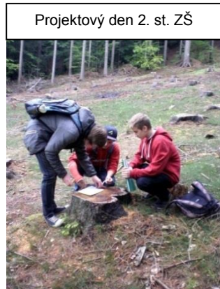
Projektový den 2. st. ZŠ

28. května vyrazili žáci 6.A do Prahy. Vyjeli na vrchol Petřína, prohlédli si zahrady kolem Štěfánikovy hvězdárny a navštívili loretu na Hradčanském náměstí. Dál se přesunuli mimo jiné na Staroměstské náměstí k Orloji a na Václavském náměstí si koupili „něco na zub“. Počasí bylo příznivé, takže se exkurze vydařila.