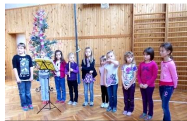
Advent na 1. stupni ZŠ

V posledním předvánočním týdnu probíhala na 1. stupni základní školy tradiční adventní setkání. Všichni žáci se sešli v tělocvičně, zpívali vánoční koledy a připomínali si vánoční zvyky. Každá třída si připravila malé vystoupení. Na 2. stupni základní školy se poslední den školy před Vánoci konaly vánoční dílny. Každý žák si dle svého zájmu vybral dvě předvánoční dílny. Pekly se perníčky, vyráběly se hvězdičky z pedigu, zpívaly se vánoční koledy a písně, vyráběly se origami z čajových sáčků, vánoční hvězdy, ozdoby a podobně. Akce se nám opravdu vydařila.