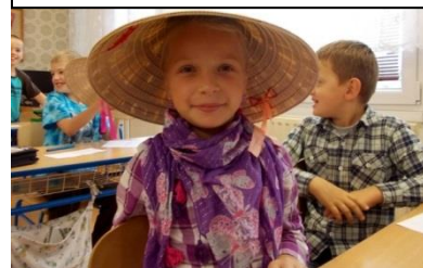
Život ve Vietnamu

2. listopadu foukal příznivý vítr, a proto se konal již 3. ročník tradiční Drakiády pro žáky 1. stupně ZŠ. Vítr byl opravdu vydatný, takže létali všichni draci bez rozdílu. V současné době se již těšíme na další ročník.