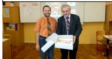
Otevření konzultačního centra

I v tomto školním roce se naše škola zapojila do recyklačního programu Recyklohraní, aneb Uklidme si svět. Program je pořádán pod záštitou MŠMT a jeho cílem je vzdělávat žáky v oblasti třídění a recyklace odpadů. Umožňuje odevzdávat použité baterie a drobná elektrozařízení do speciálních nádob umístěných v prostorách školy.