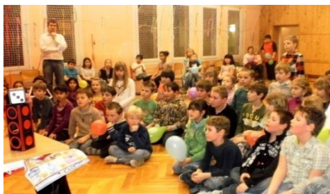
Ukončení 1. pololetí - diskotéka

31. ledna 2013 na oslavu ukončení pololetí zorganizoval žakovský parlament naší školy diskotéku pro naše žáky. Na diskotéce se mimo tance i soutěžilo a hrály se nejrůznější zábavné hry.