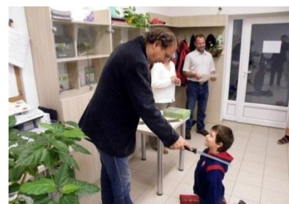
Pasování prvňáčků na čtenáře

Těsně před koncem školního roku, 26. června, jsme ve spolupráci s naším zřizovatelem pozvali prvňáčky do městské knihovny, abychom je mohli pasovat na čtenáře. Každý žák 1. třídy byl pasován na čtenáře, dostal odznáček, knížku a pamětní list. Na závěr