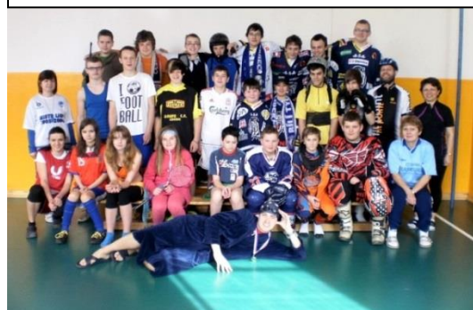
Den v oblíbeném sportovním oblečení

Před Velikonoci, dne 24. března 2013 se v České besedě konaly tradiční velikonoční dílny, které spolupřádáme s Městem Raspenava. Do dílen se zapojili učitelé naší školy a také velké množství žáků. Všem zapojeným touto cestou ještě jednou děkuji.