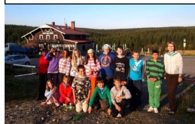
Harmonizační pobyt na Smědavě

V týdnu do 17. září do 21. září proběhl na horské chatě Smědava harmonizační pobyt žáků 6. ročníku. Tento pobyt jsme dlouho připravovali a na jeho přípravě i realizaci se podíleli všichni učitelé z 2. stupně ZŠ. Cíl, který jsme si stanovili – zlepšit vztahy v kolektivu třídy, nastavit pravidla a „seznámit se“ s učiteli 2. stupně se nám podařilo zcela jistě naplnit.