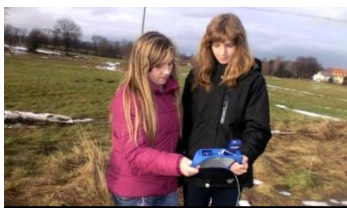
Senzory PASCO ve výuce

11. prosince se v „červeném“ kostele Na Perštýně konal další ročník tradiční Vánoční noty. Akce se zúčastnili žáci ZŠ speciální a praktické za pomoci žákyň 7. ročníku základní školy. Přihlížejícím divákům předvedli hudebně pohybové představení s názvem Bílá zima. Představení se moc líbilo, děkujeme za úspěšnou reprezentaci školy.