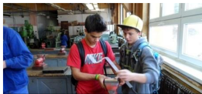
NadoTech – žáci 9. ročníku

V týdnu do 17. září do 21. září proběhl na horské chatě Smědava harmonizační pobyt žáků 6. ročníku. Tento pobyt jsme dlouho připravovali a na jeho přípravě i realizaci se podíleli všichni učitelé z 2. stupně ZŠ. Cíl, který jsme si stanovili – zlepšit vztahy v kolektivu třídy, nastavit pravidla a „seznámit se“ s učiteli 2. stupně se nám podařilo zcela jistě naplnit.