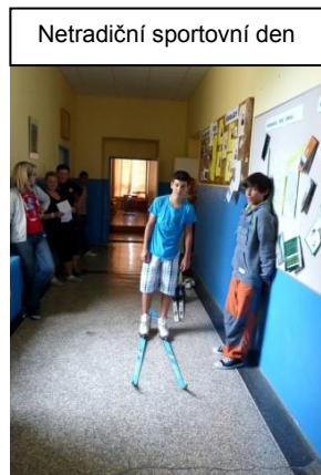
Netradiční sportovní den

24. června jsme v hlavní budově školy pořádali netradiční sportovní den. Proč netradiční? No, posuďte sami – disciplíny byly: běh do schodů s medicinbalem, koulení pneumatiky po chodbě, běh na lyžích po školní chodbě, chůze po hranolech, stavění věže z kostek, překážková dráha v tělocvičně a tahání lana. Všechny disciplíny probíhaly uvnitř budovy, protože nepříznivé povětrnostní podmínky nám nedovolily „ani vystrčit nos“ ze dveří.