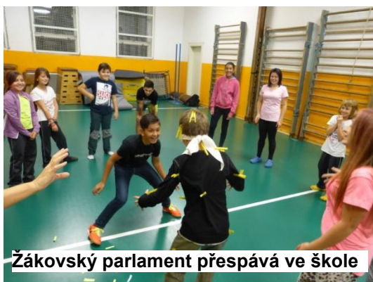
Žákovský parlament přespává ve škole

30. září 2014 jsme se zúčastnili turnaje v malé kopané, které organizovala Střední škola hospodářská a lesnická Frýdlant v Hejnicích. Ve velké konkurenci se naše družstvo umístilo na pěkném 4. místě. (diplom je mezi přílohami zprávy)