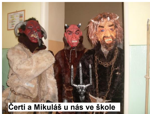
Čerti a Mikuláš u nás ve škole

5. prosince 2014 navštívil naši školu opět Mikuláš. Společně se svými přáteli – anděly a čerty prošel všechny třídy od mateřské školy až po