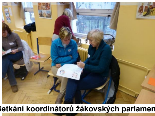
Setkání koordinátorů žakovských parlamentů

ročník základní školy. Děti mu zpívaly písničky a recitovali básničky, za což od něj mohli dostat nějaké sladké bonbónky nebo čokoládky. Jen málokdo tušil, že se pod maskami skrývali naši šikovní devátáci. Akce měla velký úspěch.