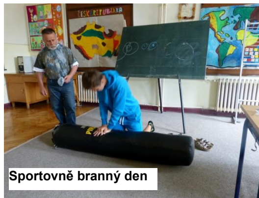
Sportovně branný den