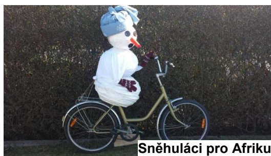
Sněhuláci pro Afriku

Během ledna a února 2015 se žáci, kteří navštěvují školní družinu, ale i ostatní žáci z 1. stupně základní školy, zapojili do akce Sněhuláci pro Afriku. Cílem akce bylo kromě stavby sněhuláků též vybírat peníze, které poslouží k financování dopravy kol pro Afriku (akce Kola pro Afriku). Vzhledem k tomu, že zima byla velmi mírná a sníh byl velkou vzácností, zúčastnili jsme se „nesněhové“ varianty a sněhuláky děti vyráběly, z čeho se jen dalo... Školní kolo u nás proběhlo 12. února 2015. Děkujeme vychovatelkám školní družiny a všem dětem, které se zúčastnily. (Pamětní list a novinový článek z Libereckého dne je uveden v přílohách.)