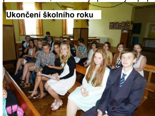
Ukončení školního roku

Dne 25. června 2015 jsme se tradičně loučili se školním rokem v sále České besedy. Této slavnostní události se účastnili všichni žáci 2. stupně a žáci ZŠS. Akci moc pěkně moderovali žáci 8. ročníku, kteří měli připravená i drobná vystoupení a scénky. Třídní učitelé předávali žákům ocenění za dobrou práci nebo za jiné záslužné činy. Když jsme se pak loučili s deváťáky, tak ukápla nejedna slzička. Po skončení akce se vycházející žáci přemístili do obřadního sálu městského úřadu. Zde k nim promluvil pan starosta, ocenil nejlepší žáky a popřál jim hodně úspěchů v dalším studiu.