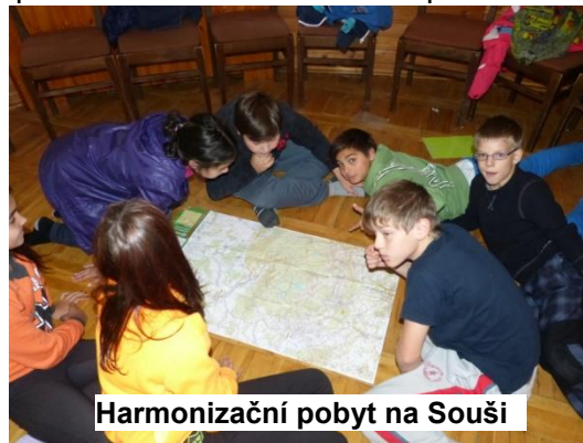
Harmonizační pobyt na Souši

V týdnu od 22. do 26. září 2014 odjeli naši šestáci s paní učitelkou třídní a s výchovnou poradkyní na harmonizační pobyt. Letos se pobyt poprvé nekonal v chatě na Smědavě, ale byl o pár kilometrů dál, v hotelu Montanie u soušské přehrady v Desné. Oproti Smědavě měly děti luxusnější ubytování v pěkných pokojích s příslušenstvím přímo na pokoji. Počasí nám sice zrovna moc nepřálo, ale i přes to se nám pobyt vydařil. Pracovali jsme s celým kompletním třídním kolektivem a kromě nastavení pravidel ve třídě a spousty aktivit na zlepšení vztahů ve třídním kolektivu děti stihly ještě velmi zajímavou exkurzi v úpravně vody a v rámci výletu na Jizerku též exkurzi ve stanici Horské služby s prohlídkou techniky a nácvikem první pomoci. Harmonizační pobyt se dětem moc líbil.