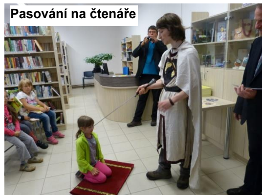
Pasování na čtenáře

V úterý 23. června 2015 se naši prvňáci odebrali do městské knihovny. Zde je již čekala paní knihovnice, pan starosta a pan