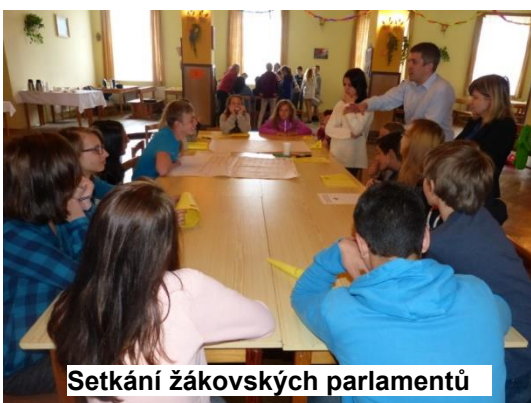
Setkání žákovských parlamentů

V pondělí 4. května 2015 přivítal náš žákovský parlament své kolegy z žákovských parlamentů ZŠ Lázně Bělohrad a ZŠ Trutnov.