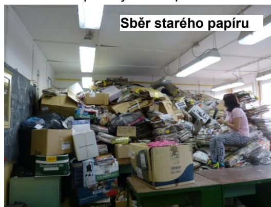
Sběr starého papíru

Dne 20. listopadu 2014 navštívili žáci 7. třídy s několika šestáky Okresní knihovnu v Liberci. Probíhaly zde dny GIS (geografické informační systémy). Žáci se dozvěděli, že tyto systémy často běžně používají (například při používání portálu mapy.cz nebo mapy google). Akce se žákům moc líbila.