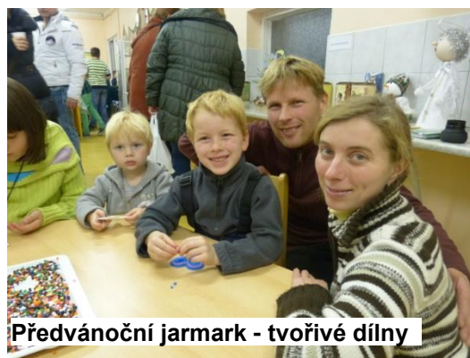
Předvánoční jarmark - tvořivé dílny

Účast veřejnosti byla obrovská. Přestože jsme měli již zkušenost z loňského jarmarku, byli jsme znovu mile překvapeni, kolik přišlo návštěvníků a příjemně nás potěšily i jejich příznivé reakce. Některé jsme se dozvídali ústně – přímo na místě, jiné nám rodiče zapsali do pamětní