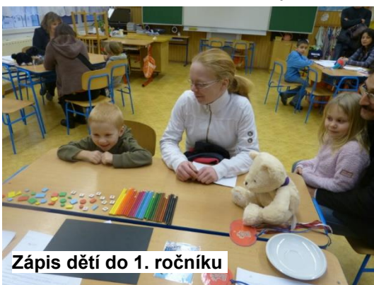
Zápis dětí do 1. ročníku

10. února 2015 se v budově 1. stupně ZŠ konal zápis dětí do 1. ročníku. Z očekávaných zhruba 35 přišlo 30 dětí se svými rodiči, někdy prarodiči, s někým dorazil i starší nebo mladší sourozenec. Každý prošel zápisem u paní učitelky,