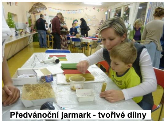
Předvánoční jarmark - tvořivé dílny