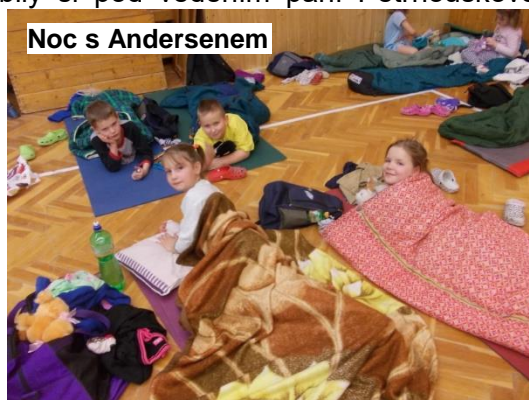
Noc s Andersenem