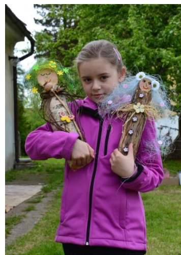
Raspenavské tvořivé hrátky

Každý, kdo zavítal na raspenavskou faru ve dnech 21 - 23. května, se mohl zapojit do zábavného tvoření, které pro širokou veřejnost připravil kolektiv učitelů a žáků naší školy společně s vedoucími Terapeutické dílny Domova Raspenava. Na organizaci se také podílelo několik rodičů a přátel školy. Pro letošní „RASPENAVSKÉ TVOŘIVÉ HRÁTKY“ jsme připravili řadu výtvarných dílen, hry, soutěže, výstavu výtvarných prací na téma „Moje Jizerky“ a ukázky práce několika zájmových kroužků,