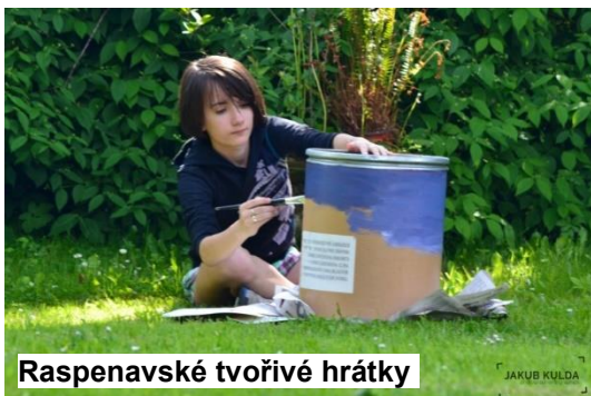
Raspenavské tvořivé hrátky