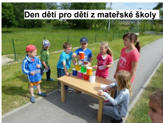
Den dětí pro děti z mateřské školy

V pondělí 1. června 2015 uspořádali členové žakovského parlamentu Dětský den pro