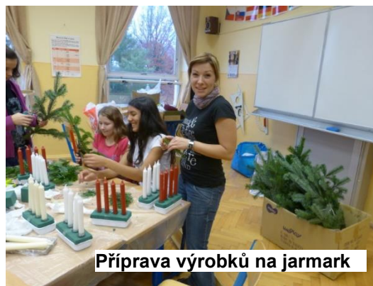
Příprava výrobků na jarmark

Školní předvánoční jarmark se pak konal v pátek 28. listopadu 2014. Tentokrát se konal nejen v budově 1. stupně základní školy, ale, po loňských zkušenostech, ještě i ve školní jídelně. Začátek jarmarku byl v 16:00 hodin venku, před budovou školy u rozsvíceného a ozdobeného vánočního stromku. Na úvod vystoupily děti z 1. stupně s krátkým programem složeným