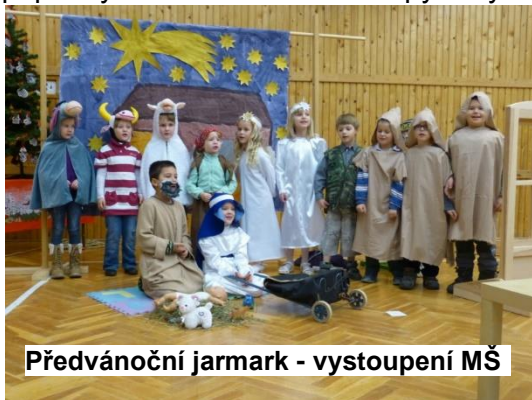
Předvánoční jarmark - vystoupení MŠ

z vánočních koledí, písniček a básniček. Když vystoupení skončilo, začaly se přesouvat desítky rodičů, dětí a dalších návštěvníků k jednotlivým tvůrčím dílnám. Těch bylo celkem 17. Bylo možné si vyrobit vánoční věnec na dveře, adventní svícen, vánoční svíček, vánoční kouli, papírový stromeček a voňavé pytlíčky s vánoční vůní. Kdo měl zájem, mohl si dále ozdobit