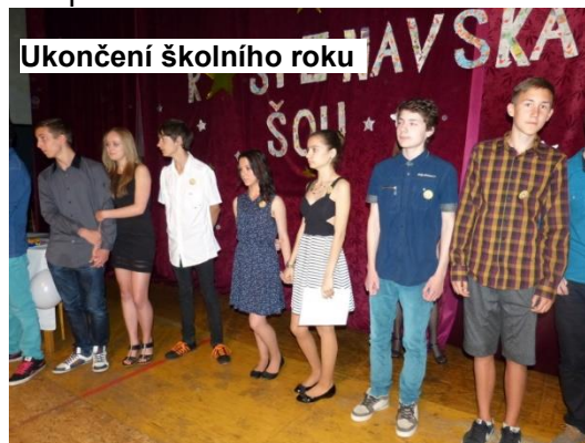
Ukončení školního roku

V textu jsou použity části úryvky nebo celé články z webových stránek naší školy napsané učiteli: Mgr. Libuše Lžičarová, Mgr. Pavlína Vlková