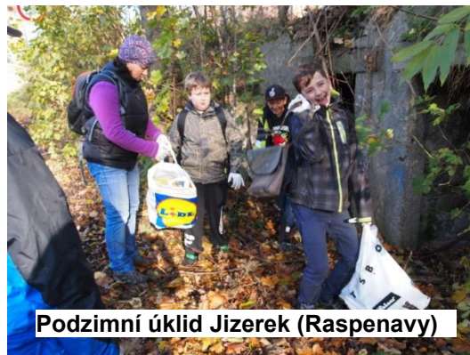
Podzimní úklid Jizerek (Raspenavy)

V sobotu 25. 10. 2014 se naše škola opět zapojila do podzimní akce „Uklidme Jizerky“, kterou pořádá Společnost pro Jizerské hory. Jelikož se naše obec rozkládá v severozápadním podhůří Jizerských hor, zvolili jsme si Raspenavu pro letošní podzimní úklid a trasu jsme nazvali „Raspenavou tam a zpět“. Za tři a půl hodiny jsme ji zdaleka celou neprošli, přesto se podařilo v počtu 17 žáků a 5 učitelek nasbírat 9 pytlů odpadu. Nacházeli jsme spoustu klasických odpadků, co lidem nejspíš vypadnou při chůzi z ruky, nebo jim náhodou vyletí po cestě z auta. Zároveň jsme ale nacházeli i méně tradiční odpadky, které nás docela překvapily. Pro představu – školní aktovka, podsedák na židli, bačkory, bundy, mikina, trenky, kabelka, malířská štetka, deštník, noha od panenky, umělá závěsná květina, a spoustu dalších.