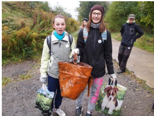
Uklidmě si Jizerky

V sobotu 17. října 2015 jsme se zúčastnili tradiční podzimní akce „Uklidme Jizerky“. I přes ne úplně příznivé počasí se ráno sešlo před školou 14 žáků a 3 učitelé. Vybaveni rukavicemi a pytli jsme vyrazili uklízet Raspenavu a její nejbližší okolí. Celkem jsme za 3 hodiny v terénu naplnili odpadem 10 pytlů. Kromě tradičních drobných odpadků jsme