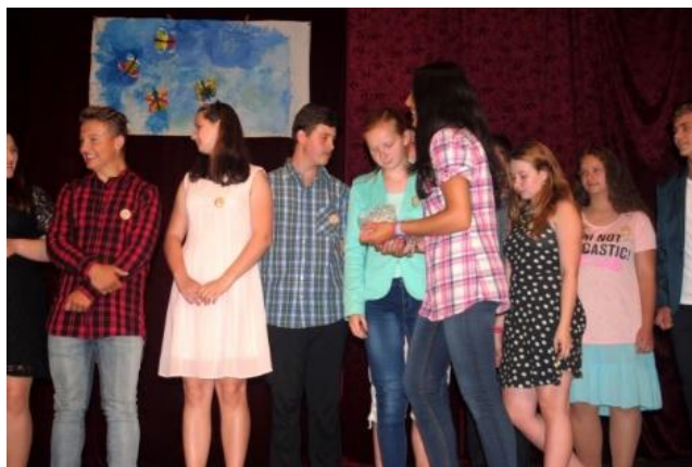
Ukončení školního roku v České besedě

29. června 2016 jsme se tradičně loučili se školním rokem v sále České besedy. Této slavnostní události se účastnili všichni žáci 2. stupně, pátáci a žáci ZŠS. Akci moc pěkně moderovali žáci 8. ročníku, kteří měli připravená i drobná vystoupení a scénky. Třídní učitelé předávali žákům ocenění za dobrou práci nebo za jiné záslužné činy. Když jsme se pak loučili s devátáky, tak ukápla nejedna slzička. Po skončení akce se vycházející