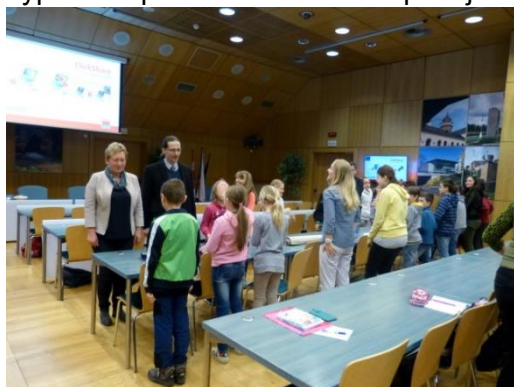
Setkání žákovských parlamentů - KULK

V noci z 15. na 16. dubna 2016 uspořádala paní vychovatelka školního klubu tradiční spaní ve školním klubu. Pro účastníky byly připraveny různé hry a soutěže, také společné vyprávění příběhů... Akce se opakuje několikrát do roka a je mezi dětmi velmi oblíbená. Školní klub většinou úplně praská ve švech a k nocování musíme využívat i školní jídelnu.