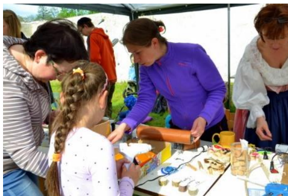
Raspenavské tvořivé hrátky

Každý, kdo navštívil raspenavskou faru ve dnech 12. – 14. května, se mohl zapojit do zábavného tvoření, které pro širokou veřejnost připravil kolektiv učitelů a žáků ZŠ a MŠ Raspenava společně s vedoucími Terapeutické dílny Domova Raspenava. Na organizaci se také podílelo několik rodičů a přátel školy. Pro letošní „RASPENAVSKÉ TVOŘIVÉ HRÁTKY III“ jsme připravili řadu výtvarných dílen, hry, „Život v Jizerkách“ a ukázky práce několika