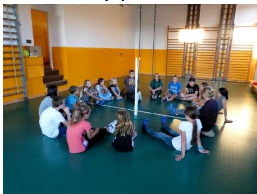
Spaní žákovského parlamentu ve škole

V úterý 6. října se skupina žáků 7. ročníku vypravila na exkurzi do Bischofswerdy. Akce proběhla v rámci přeshraniční spolupráce mezi městy Raspenava a Bischofswerda. Žáci navštívili místní zoologickou zahradu, kde byl pro ně připravený program. Nejprve byli rozděleni do smíšených družstev, ve kterých pak společnými silami řešili vědomostní kvíz a vyráběli modely výběhu pro medvědy. Zajímavé bylo také