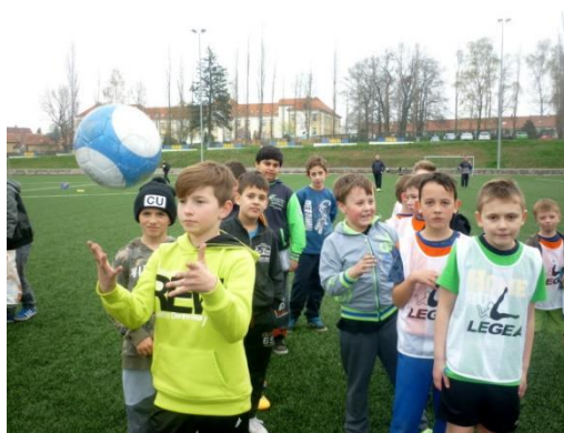
Mc Donald's Cup

12. dubna 2016 se fotbalisté ze 3. – 5. ročníku zúčastnili fotbalového turnaje McDonalds Cupu. Počasí nám přálo natolik, že se turnaj mohl uskutečnit venku na travnatém hřišti ve Frýdlantu. V kategorii 1. – 3. ročník jsme obsadili 4. místo a v kategorii 4. – 5. ročník 3. místo – gratulujeme.