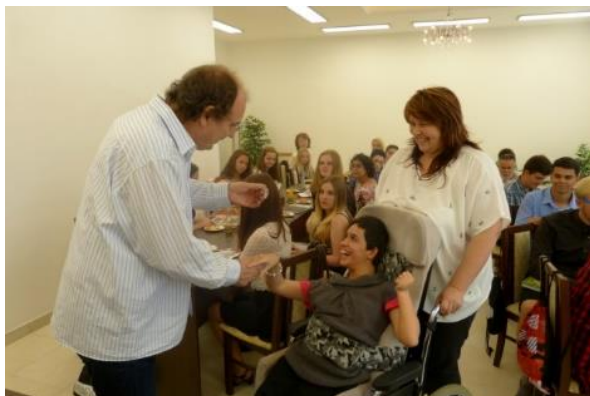
Ukončení školního roku – setkání s panem starostou