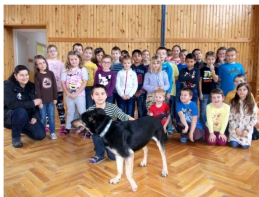
Sběrka krmiva pro útulek

S naším žakovským parlamentem jsme si řekli, že by bylo dobré uspořádat charitativní předvánoční sbírku pro psy a kočky. Nejdříve jsme se samozřejmě museli zeptat ve třídách, zda by se této akce chtěli zúčastnit a jestli se sbírkou souhlasí. Naštěstí se přihlásilo hodně žáků, takže jsme se pustili do příprav. Potřebovali jsme vyrobit plakáty, připravit hlášení, pozvali jsme do akce i spolužáky z prvního stupně. Sběrka se uskutečnila od 14. do 18. prosince 2015. Každý den jsme vybírali od