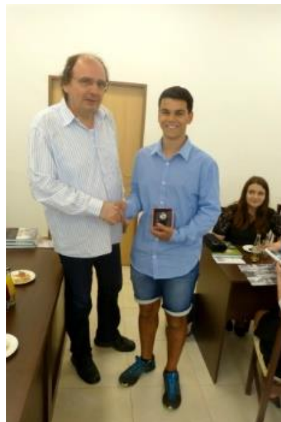
Ukončení školního roku – setkání s panem starostou

V textu jsou použity části úryvky nebo celé články z webových stránek naší školy napsané učiteli: Mgr. Libuše Lžičařová, Mgr. Pavlína Víková, Mgr. Bc. Petr Kozlovský, Mgr. Hana Lipenská a další.