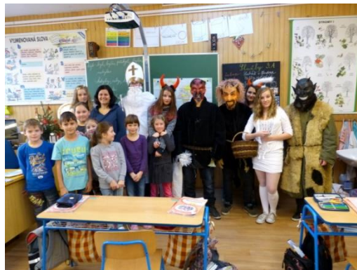
Mikuláš, Čert a Anděl u nás ve škole

4. prosince 2015 navštívil naši školu Mikuláš, Andělé a Čerti. Poctivě navštívili všechny třídy školy a prověřili, zda byly všechny děti hodné a jestli někdo z nich nezlobil. Asi ne, protože ještě i v 9. třídě byly pytle čertů úplně prázdné. Děti návštěvníkům zazpívali nebo jim recitovali básničky.