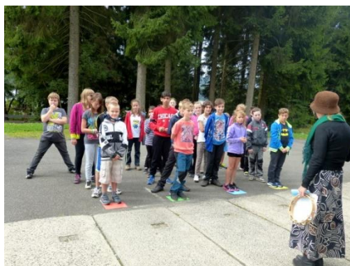
Harmonizační pobyt žáků 6. ročníku

V září jsme prožili jeden týden na harmonizačním pobytu. Byli jsme ubytováni v hotelu Montanie. Zažili jsme tu spoustu legrace u různých her. Asi nejvíce jsme se všichni pobavili u tzv. kolíčkované. Téměř každý den jsme vyrazili na nějaký výlet, například jsme se byli podívat za horskou službou na Jizerce. Společný týden jsme završili noční stezkou odvahy a foto projekcí. Poněvadž jsme spolu trávili tolik času, mohli jsme zde pohlédnout na své kamarády, spolužáky a učitele zcela jinými očima než ve škole. Doufám, že na tento týden bude všichni rádi vzpomínat, ač už třeba školní lavice dávno opustíme.