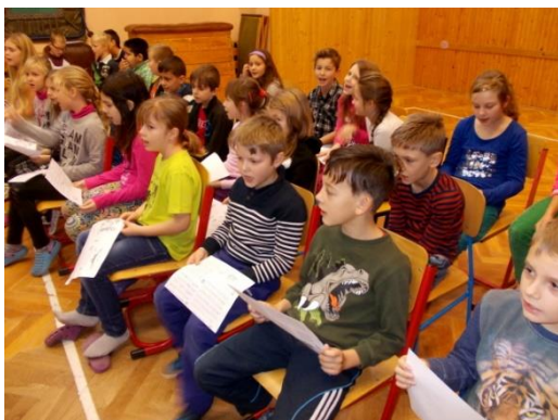
Advent na 1. stupni ZŠ

Poslední týden před Vánoci se děti na 1. stupni ZŠ tradičně všechny setkávají v tělocvičně, aby si připomněly Advent. Zpívají se koledy, připomínají se vánoční zvyky a všichni se už společně těší na Vánoce.