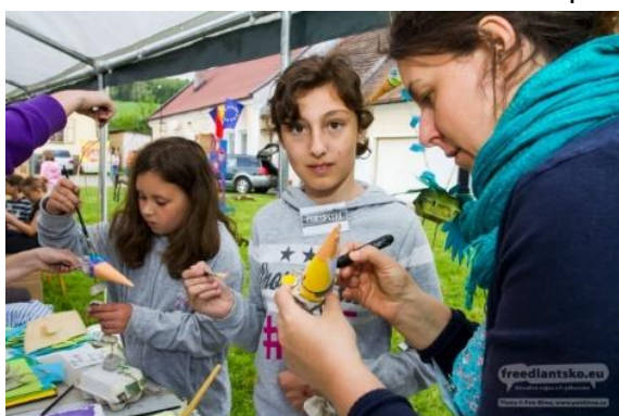
Raspenavské tvořivé hrátky

Od 12. do 14. května se v prostorách raspenavské fary konal další ročník