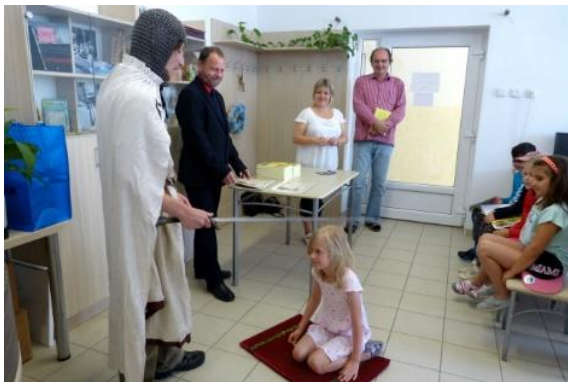
Pasování na čtenáře

22. června 2016 se naši prvňáčci vydali do městské knihovny v Raspenavě. Tam už na