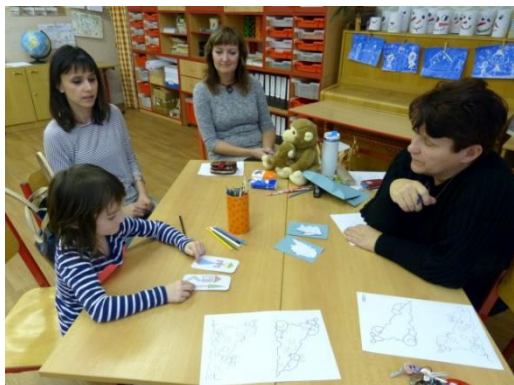
Zápis dětí do 1. ročníku ZŠ

sourozenec. Každé dítě prošlo zápisem u některé paní učitelky, muselo splnit několik jednoduchých úkolů a nakreslit obrázek. Ve vedlejší učebně potom probíhal samotný zápis. Všichni budoucí prvňáčci si také domů odnesli malou vzpomínku na svůj zápis v podobě pamětního listu, dárečku, který vyrobily děti ze školní družiny s paními vychovatelkami a ještě malé stavebnice Lego na hraní. Zápisu se, stejně jako vloni též zúčastnily paní učitelky z mateřské školy, které přišly především „podpořit“ děti z mateřské školy, aby se cítily jistější a také se podívat, jak jim to u zápisu jde. Zapsali jsme celkem 31 dětí. 9 rodičů bude žádat pro své děti odkad