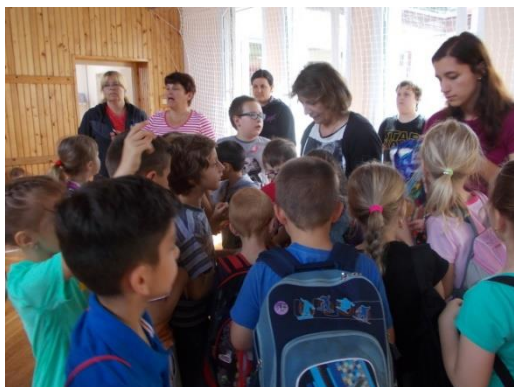
Den dětí na 1. stupni základní školy

3. června 2016 připravily paní učitelky z 1. stupně základní školy pro děti sportovně zábavné dopoledne k mezinárodnímu dni dětí. Vzhledem k ne úplně příznivému počasí se většina disciplín musela konat uvnitř budovy, ale i přes to se akce vydařila. Děkujeme organizátorům.