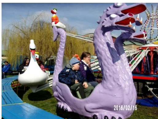
Z Matějské pouti

16. února 2016 podnikli žáci naší základní školy speciální výlet do Prahy na Matějskou pouť. Cestování v hromadných dopravních prostředcích nebyl pro děti žádný problém. Navštívili jsme Matějskou pouť a využili možnost volného vstupu na mnoho tamních atrakcí. Žáci se zapojili i do připravených výtvarných dílen a mnoho zážitků si odnesli i z kouzelného podmořského světa.