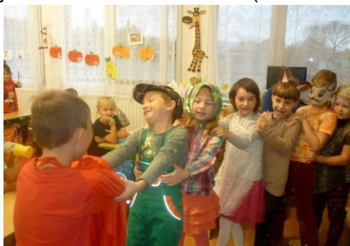
Pohádka O veliké řepě v 1. třídě

V průběhu října a začátku listopadu prožili žáci 1. třídy několik tematicky zaměřených dní. Nejdříve se nechali inspirovat Zahradou Čech a udělali si výstavu krásných jablíček. Další tematický den byl zaměřený na pohádku O perníkové