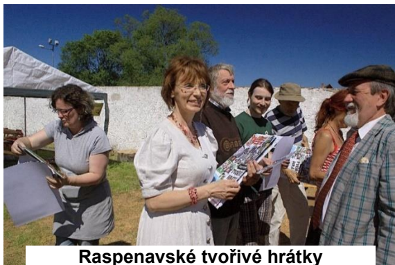
Raspenavské tvořivé hrátky