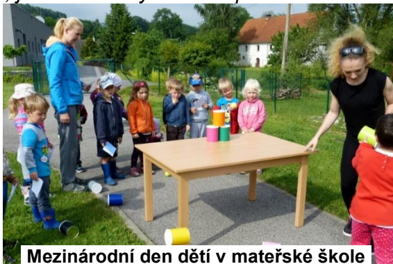
Mezinárodní den dětí v mateřské škole

„S parlamentem jsme 31. 5. 2017 uspořádali pro děti z naší mateřské školy Dětský den. Před školkou jsme se sešli už ráno, abychom stihli připravit stanoviště. Když už byla všechna stanoviště připravena, šli jsme si ještě natrénovat, jak budeme vysvětlovat pravidla úkolů. Po chvíli bylo vše připraveno, a tak začaly děti pomalu chodit. Postupně plnily všechna stanoviště a za každé splněné stanoviště dostaly razítko na svou kartu. Na konci, když už měly děti nasbíraná všechna razítka, dostaly od nás medaile. Kluci dostali sloníka a holky dostaly žirafku. I my jsme dostali odměnu v podobě zmrzliny, za to, že jsme pro děti uspořádali super dopoledne, které se snad všem líbilo. A nakonec jsme skoro všichni parlamentáři odešli s razítkovou nemocí :-).“