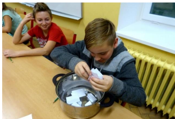
Spaní žákovského parlamentu ve škole

„Jako každý rok se i letos konalo spaní ve škole. Sešli jsme se v pátek 21. října 2016 v 16:00 hodin. Bylo to zajímavé spaní, jelikož tam byli s námi i noví členové našeho žákovského parlamentu. Takže jsme si na začátek zahráli hru na seznamování. Potom jsme si zahráli hru