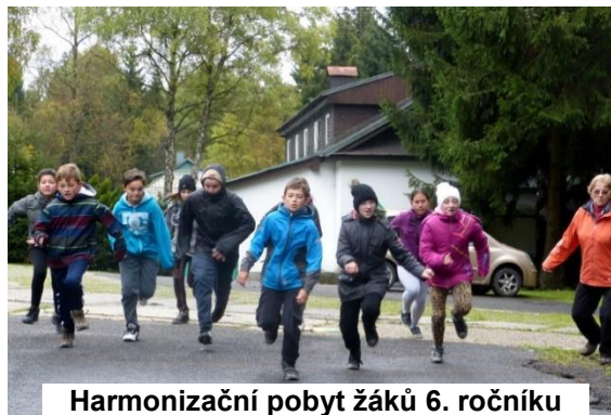
Harmonizační pobyt žáků 6. ročníku

V říjnu jsme prožili jeden týden na harmonizačním pobytu. Byli jsme ubytováni v hotelu Montanie. Zažili jsme tu spoustu legrace u různých her. Asi nejvíce jsme se všichni pobavili u tzv. kolíčkované. Téměř každý den jsme vyrazili na nějaký výlet, například jsme se byli podívat za horskou službou na Jizerce. Společný týden jsme završili noční stezkou odvahy a foto projekcí. Poněvadž jsme spolu trávili tolik času, mohli jsme zde pohlédnout na své kamarády, spolužáky a učitele zcela jinýma očima než ve škole. Doufám, že na tento týden bude všichni rádi vzpomínat, ač už třeba školní lavice dávno opustíme.