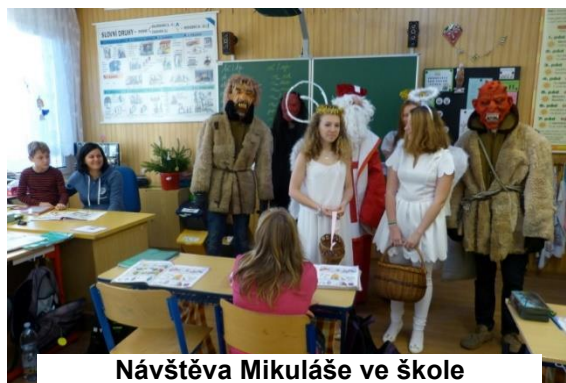
Návštěva Mikuláše ve škole