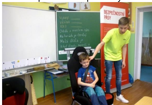
Den s dopravní výchovou

5. dubna 2017 proběhl na 1. stupni základní školy Den s dopravní výchovou. Školu navštívili pracovníci bezpečnostních složek a seznámili děti s tím, jak dbát na bezpečnost vlastní i druhých osob při různých činnostech.