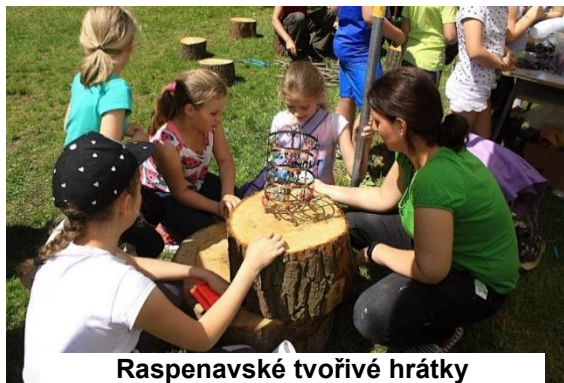
Raspenavské tvořivé hrátky