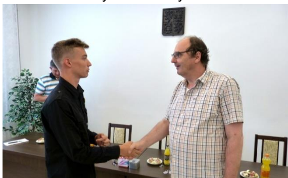
Rozloučení s devátáky na městském úřadu

29. června – předposlední školní den máme již několik let slavnostní ukončení školního roku v České besedě. Akci mají za úkol zorganizovat žáci z 8. ročníku. Ti připraví program, veselé scénky, hudbu a uvádění programu. V samotném programu se pak představí každá třída a třídní učitelé rozdají odměny těm nejlepším. Vyhlašujeme zde také osobnosti školy v některých oblastech (jazyky, žákovský parlament, sportovec...)