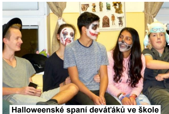
Halloweenské spaní devátáků ve škole

„V úterý 25. října 2016 si třída 9. A uspořádala již tradiční a pro třídu poslední halloweenskou párty spojenou s přespáním ve škole. Podmínkou účasti byla alespoň maska na obličeji a drobné občerstvení pro spolužáky. Tentokrát si většinu aktivit na večer připravili sami žáci. A protože je to parta správných teenagerů se smyslem pro humor, tak jsme se celý večer opravdu dobře bavili. Tradičně jsme měli hry na ochutnávání všeho možného i nemožného, tentokrát i v podobě zákeřných jelly beans, které byly buď velmi chutné, anebo velmi nechutné. Samozřejmě měli všichni největší radost,