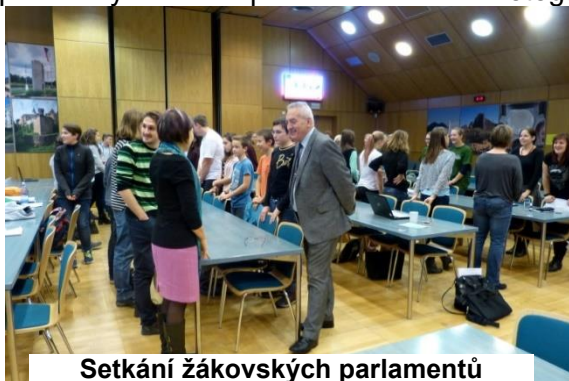
Setkání žakovských parlamentů

základních školách z pohledů žáků. To, jak se dětem na krajském úřadě líbilo a jak pěkně pracovaly si můžete prohlédnout v naší fotogalerii.