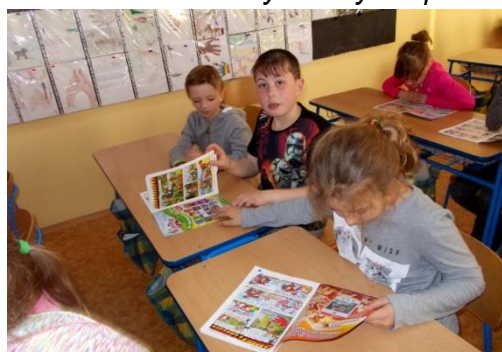
Noc s Andersenem

No a pak už se četlo – tématem letošní noci byl nestárnoucí Čtyřlístek, který vychází už od roku 1969 – děti dostaly úkoly, které se Čtyřlístku týkaly a tak jim nezbývalo, než si ho pořádně nastudovat. Musím konstatovat, že takhle zapálené jsme je ještě neviděli, na některých bylo vidět neskrývané nadšení při čtení. Pak jsme si trochu protáhli těla, ustali v tělocvičně a přišla na řadu pohádka, taneček a procházka školou při svíčkách, kdy nechyběla pohádková soutěž. Všichni jsme si noc skvěle užili a už teď se těšíme za rok při čtení na viděnou :-).“