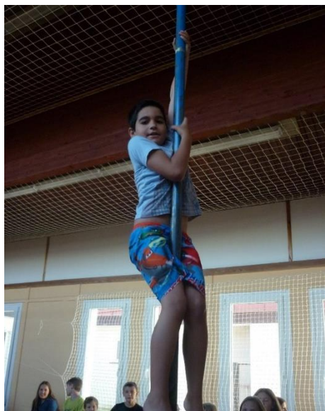
Šplháme na Sněžku

připočítaly tyto metry. Každá skupina tedy musela vylézt 400 krát a k tomu ještě další tři metry, aby dosáhly vrcholu Sněžky. O trochu rychleji vrcholu dosáhli Červení, Modří se ale statečně drželi svých soupeřů a k vyšplhání potřebovali jen dvě "šplhací přestávky" navíc. Za odměnu za tento úžasný víkend všechny děti obdržely diplomy, hopíky a bonbóny. Ráda bych všechny děti moc pochválila, byly úžasné – Lenka Kubíková.