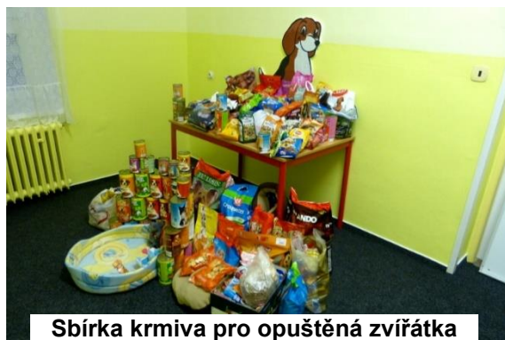
Sbírka krmiva pro opuštěná zvířátka