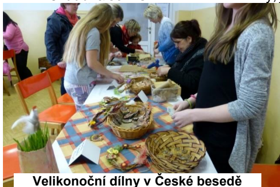
Velikonoční dílny v České besedě

tým žáků 4. – 5. třídy, který obsadil 3. místo. Oběma týmům gratulujeme. (Diplomy jsou mezi přílohami.)