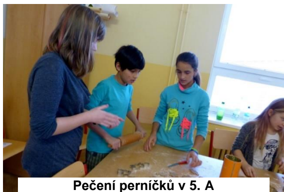
Pečení perníčků v 5. A