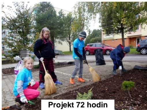
Projekt 72 hodin