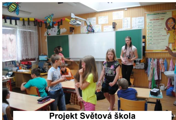
Projekt Světová škola

„Projekt, který připravili studenti frýdlantského gymnázia, byl určen pro žáky 3. - 5. tříd. Tříhodinový blok byl zaměřen na poutavá povídání s handicapovanými mladými lidmi – vozíčkáři a nevidomou slečnou, kteří dětem vyprávěli nejen o svých problémech, ale i životě, který mají leckdy bohatší, než si my zdraví dokážeme představit. Na jednom ze stanovišť si děti mohly vyzkoušet některý z handicapů – vyzkoušely si přejít překážkovou dráhu se zavázanýma očima, hmatem rozpoznávat písmenka a také se naučily pár slov ve znakové řeči. Program byl velmi zajímavý a pro děti opravdu poutavý. Všem, kteří projekt připravili, děkujeme.“