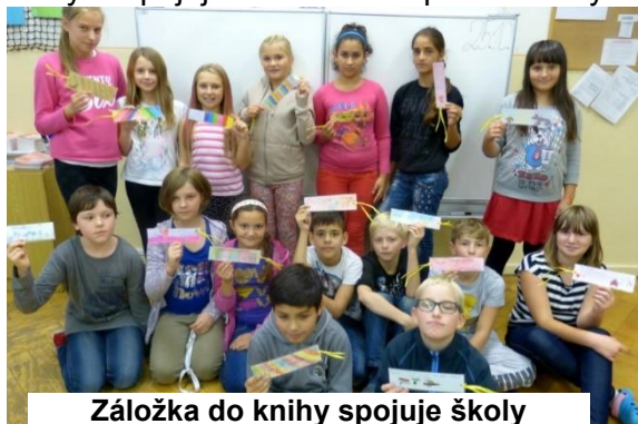
Záložka do knihy spojuje školy

V listopadu se žáci z 1. stupně ZŠ zapojili již tradičně do akce Záložka do knihy spojuje školy. Připojuji informace od paní učitelky Gondkovské: