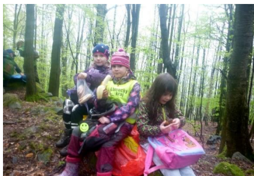
Den s Lesy ČR

„Pondělní odpoledne na konci dubna strávily děti z první třídy se svými rodiči ve škole na minibesídce a výtvarných dílnách. Děti zazpívaly a zrecitovaly básničky, předaly maminkám vlastnoručně vyrobená přáníčka a sladké pohoštění a poté se vydaly i se svými sourozenci po stanovištích. Na každém stanovišti na ně čekala jedna z maminek s perfektně připravenou výtvarnou dílničkou. Další maminky pomáhaly svým i dalším dětem. Společně jsme strávili příjemné odpoledne a já bych ráda poděkovala rodičům za jejich věnovaný čas, energii a peníze pro raspenavské prvňáčky.“