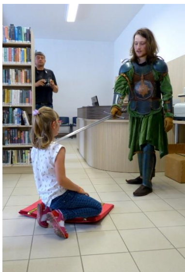
Pasování na čtenáře

27. června jsme ve spolupráci s městem a městskou knihovnou pozvali naše prvňáky do knihovny, aby zde byli pasováni na čtenáře. Akci pořádáme již řadu let, takže se jedná o pěknou tradici. Děti mají v knihovně za úkol nejprve dokázat, že jsou již opravdu čtenáři a musí odpovědět na otázky související se čtením a literaturou. Pak již přijde pasování. Děti pasuje opravdový rytíř opravdovým mečem. Děti dostávají upomínkovou plaketu, glejt a knížku na čtení. Děkujeme panu starostovi, panu místostarostovi a paní knihovnici za organizaci této pěkné akce.