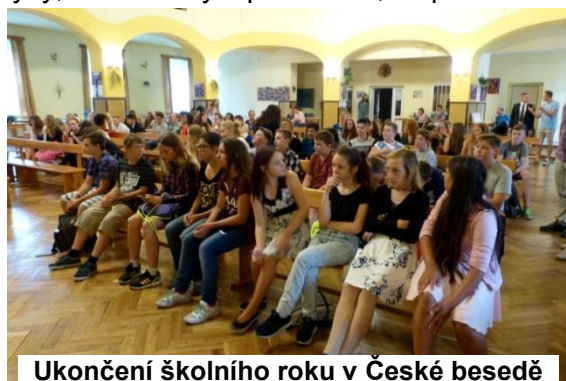
Ukončení školního roku v České besedě