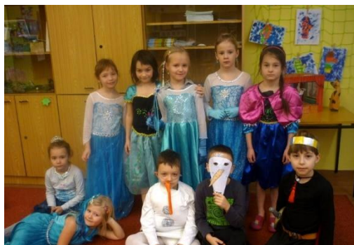
1. A v „Ledovém království“

„V pondělí 6. 2. 2017 si děti v první třídě prožily celý den v zajištění Ledového království. Na začátku dne si děti ve skupinách vyrobily opravdovou zmrzlinu, podívali jsme se, jak Titanic narazil na ledovou kru a v minulém týdnu jsme si vyráběly barevné ledové koule. Děti po celý den plnily zadané úkoly ve skupinkách i jednotlivě a za každý úkol získávaly ledové korálky, které na konci dne vyměnily za sladkou odměnu. Vyrobit si sněhuláčka Olafa, naučily se písničku Rampouch a na konci dne si vzájemně rozehřívaly ruce hrou Tělový balzám. Děti moc bavila hra Puzzle banka, kdy za spočítané příklady získávaly části obrázků z Ledového království, které pak vyskládaly a nalepily na připravený papír. Děti měly opět krásné masky, velké poděkování patří i rodičům za jejich přípravu.“