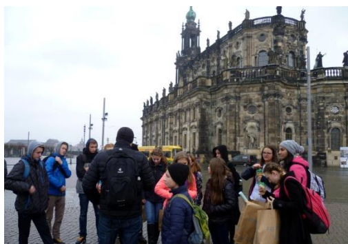
Exkurze 9. A do Drážďan

Těsně před Vánoci nastává čas, kdy se v jednotlivých třídách konají vánoční besídky, do výuky se zařazují různé méně tradiční aktivity tak, aby se u dětí ještě více podpořilo těšení na Vánoce.