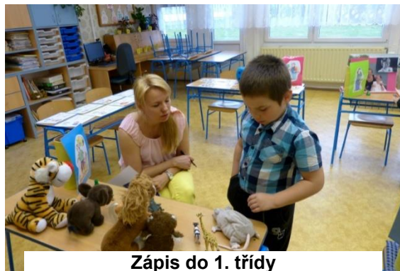
Zápis do 1. třídy

Děkujeme paním učitelkám z 1. stupně ZŠ za přípravu krásného zápisu a paním vychovatelkám a dětem ze školní družiny za výrobu dárečků pro budoucí prvňáčky.