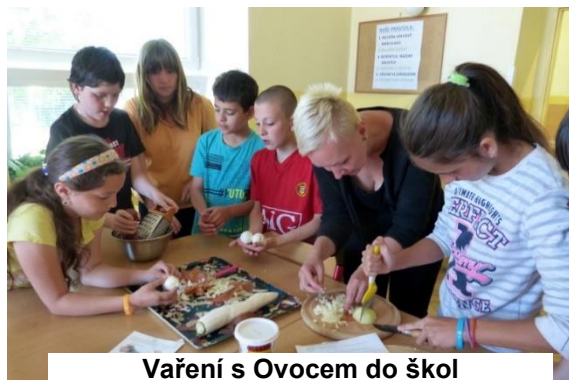
Vaření s Ovocem do škol

V průběhu března - června se 40 dětí z prvního stupně vydalo na cestu na Sněžku. Nejednalo se však o turistický výlet, ale o soutěž ve šplhání. Soutěže se zúčastnily děti z 1. - 4. třídy. Každý den se sešly během dvou přestávek v tělocvičně a každý za svůj tým se snažil co nejrychleji vyšplhat po tyči. Tyč měří 4 metry a tak se po každém vyšplhání týmu