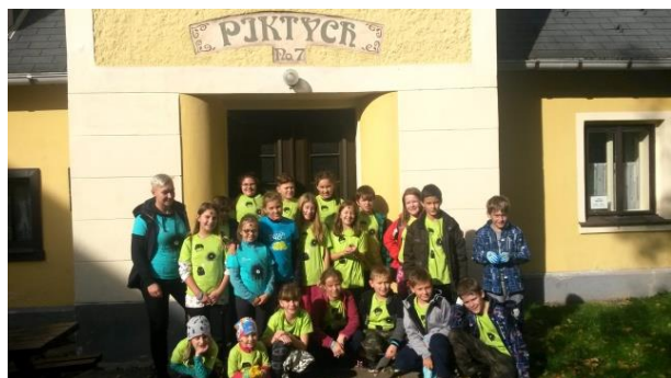
Ubytování v chalupě Piktych

Ve středu jsme vyrazili po škole a čekali nás ubytování, společná večere, hraní společenských her a taky několik her, při kterých jsme si vyzkoušeli něco nového.