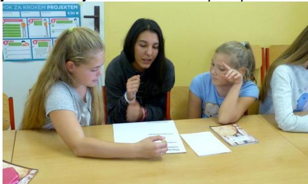
Spaní žákovského parlamentu ve škole

Z pátku 20. října na sobotu 21. října 2017 přespával ve škole žákovský parlament. Že se nejednalo pouze o spaní a celý průběh akce nám dokreslí článek viděný očima jednoho parlamentáka: V pátek 20. října 2017 se opět uskutečnilo spaní ve škole. Sešli jsme se v 16:00 v naší parlamentní místnosti, kde jsme se nejprve přivítali, pověděli jsme si, co všechno budeme dělat a potom jsme si šli zahrát hru do tělocvičny. Hra se jmenovala Opičky. Udělali jsme kruh a jeden z nás si stoupl doprostřed a začal dělat různé pohyby, které ostatní museli napodobovat. Cílem této hry bylo vymyslet chytrou taktiku, jak se dostat z kruhu ven. S taktikou jsme si poměrně dost lámali hlavu, a když nám paní učitelka prozradila, jak lehké to bylo, nemohli jsme tomu uvěřit. Následovala další hra jménem Pexeso. Utvořili jsme dvojice. Jedna z nich šla za dveře a ostatní dvojice se dohodli, co budou dělat. Každá dvojice měla svůj vlastní zvuk, pohyb či slovo. Rozmístili jsme se různě po tělocvičně a hra mohla začít. Ti, co byli za dveřmi, přišli a dál už to probíhalo jako