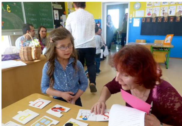
Zápis dětí do 1. ročníku

Seznamovaly se s vodními živočichy, s koloběhem vody, s využíváním vody lidmi a jejím plýtváním. Vyzkoušely si pokusy s vodou a v „laboratoři“ čarovaly kyselostí vody a nápojů. Zkusily si také, jak obtížné je donášení vody v nádobách na hlavě a povídaly si o nedostatku vody v různých oblastech Země. Pomocí kamenů a vody skryté v rostlinách si vyráběly vodní obrázky. Zahrály si na „vodní nástroj“. Projektový den byl zakončen vysvozením vodní víly Rozárky na posledním stanovišti.