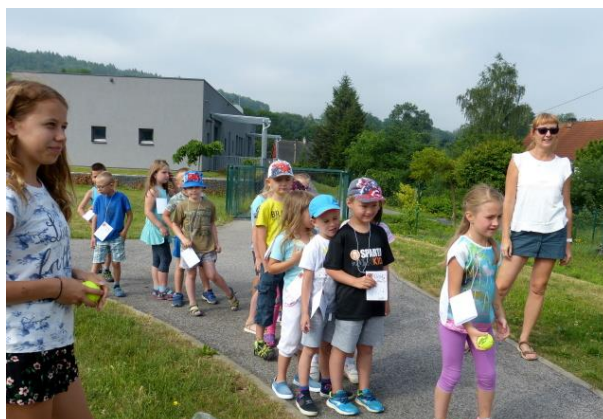
Mezinárodní den dětí v mateřské škole

25. června 2018 jsme ve spolupráci s naším zřizovatelem pozvali prvňáčky do obecní knihovny. V knihovně jsme si povídali o knížkách, o krásných pohádkách a příbězích a při té příležitosti děti navštívil pan rytíř a pasoval je na čtenáře. Před samotným pasováním děti složily slib čtenáře, kde