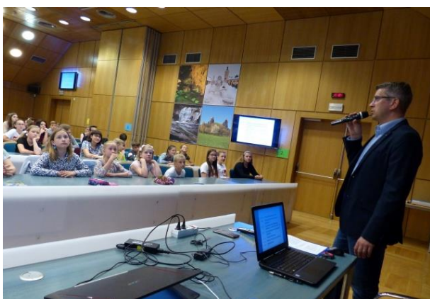
Setkání žákovských parlamentů

10. května 2018 jsme v multimediálním sále Krajského úřadu Libereckého kraje