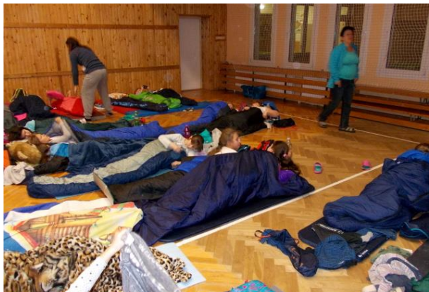
Noc s Andersenem

Všechny děti se zájmem poslouchaly vyprávění o vzniku skautingu, o pravidlech, zásadách a