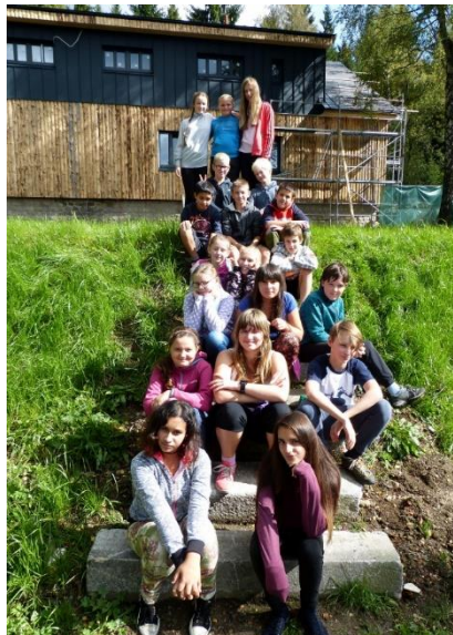
Harmonizační pobyt žáků 6. r.

V týdnu od 18. do 22. září 2017 se naši šestáci přesunuli do hotelu Montánie u přehrady Souš, aby zde absolvovali harmonizační pobyt. Cílem harmonizačního pobytu je