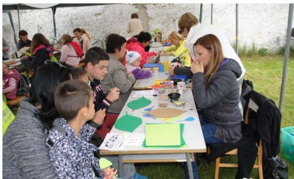
Raspenavské tvořivé hrátky