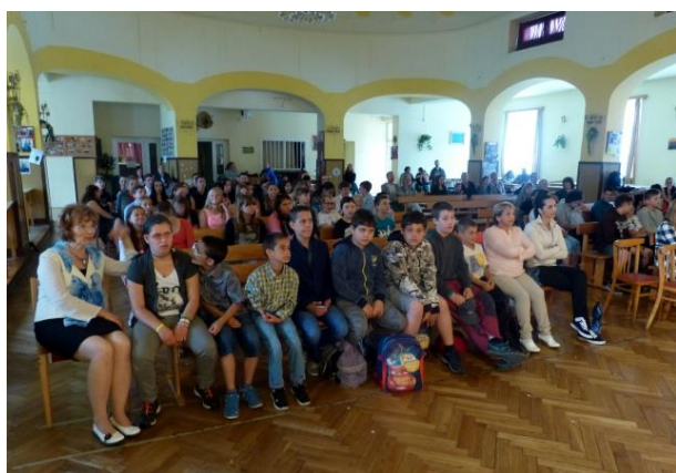
Slavnostní ukončení školního roku