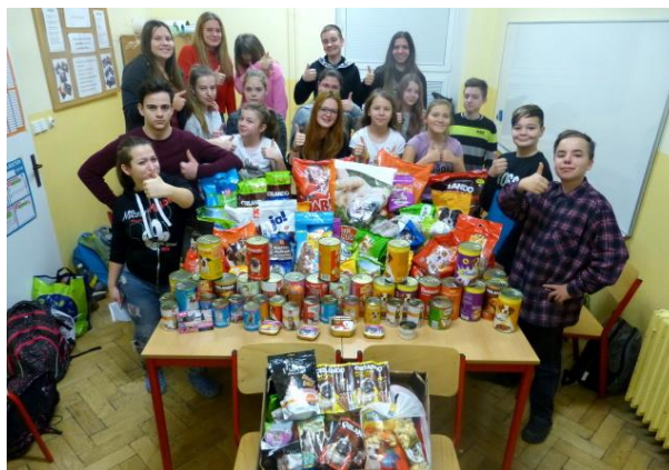
Sbírka krmiva pro opuštěná zvířátka

V prosinci se také naši prvňáčci zapojili do akce Libereckého deníku. Ten postupně představoval ve svých novinách třídy prvňáčků v celém Libereckém kraji. Fotka vyšla ve vydání dne 10. ledna 2018 a její kopie je přiložena v přílohách.