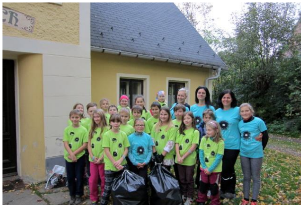
Projekt 72 hodin