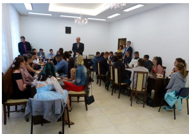
Schůzka vycházejících žáků s vedením města