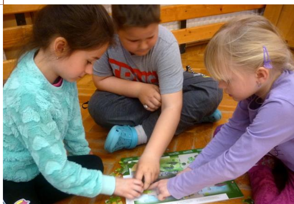
Projektový den vody

V pátek 13. dubna 2018 se žáci 1. stupně zapojili do projektového dne o vodě. Je to projektový den, který tradičně pořádáme též na 2. stupni základní školy. Příkládám článek paní učitelky Lenky Kubíkové: Učitelky a asistentky pedagoga si pro děti připravili 12 stanovišť. Celý den byl zahájen motivační pohádkou. Poté děti ve skupinách sestavených z dětí z různých tříd plnily zadanou práci na stanovištích.