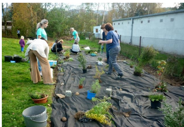
Budování školní zahrady

Ten samý pátek odpoledne se u budovy 1. stupně základní školy sešli rodiče, učitelé a děti. Všichni společně se pustili do budování školní zahrady. Přikládám článek paní učitelky Lenky Kubíkové, která o akci napsala pěkný článek: V těsné blízkosti budovy B základní školy v Raspenavě vzniká školní přírodní zahrada, kterou budou využívat žáci 1. stupně.