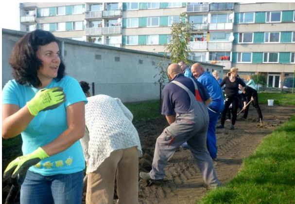
Budování školní zahrady

Velký finanční příspěvek byl získán z programu Pomáháme pomáhat od firmy KNORR-