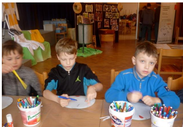
Medové jaro ve 2. třídě