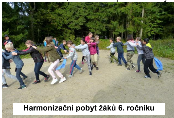
Harmonizační pobyt žáků 6. ročníku