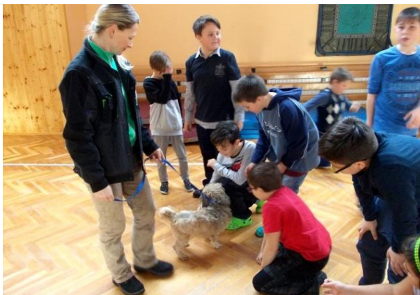
Návštěva z Azyl pes Krásný Les

V návaznosti na sbírku krmiva nás 19. ledna navštívila milá návštěva z útulku Azyl pes v Krásném Lese. Přijela paní ošetřovatelka a přivezla dětem ukázat jednoho z nalezených pejsků. Děti měly možnost dovědět se vše, co je zajímalo o pejskovi i o útulku v Krásném Lese. Důležitá pro ně byla i informace o tom, jaké jsou podmínky pro to, aby si mohly libovolného psa z útulku pořídit domů.