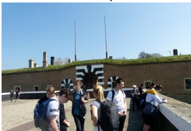
Exkurze do Památníku Tereziň

18. dubna 2018 odjeli žáci z 9. ročníku a několik žáků ze 7. a 8. ročníku na exkurzi do