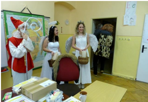
Návštěva Mikuláše ve škole

5. prosince navštívil naši školu Mikuláš s čerty a anděly. Je to již tradice, že se naši