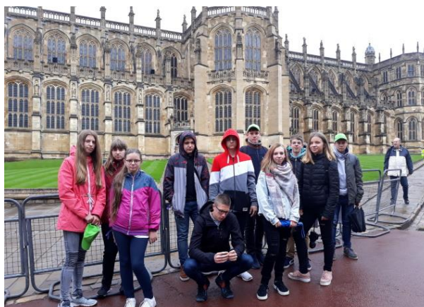
Exkurze žáků do Anglie

19. dubna se naši žáci zúčastnili oblastního kola dopravní soutěže malých cyklistů. Ve velké konkurenci obsadili pěkné 4. místo. Gratulujeme šikovným cyklistům.