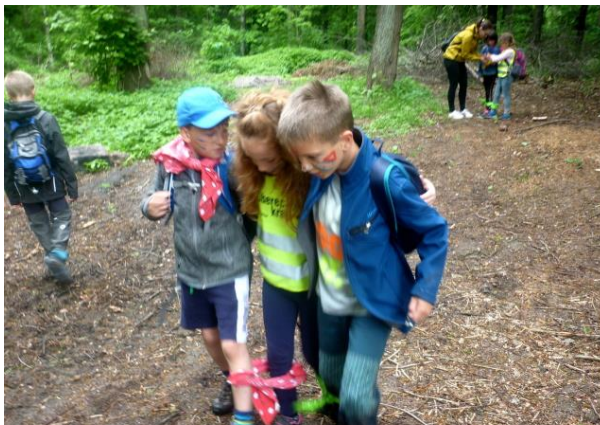
2. A ve Střevlíku