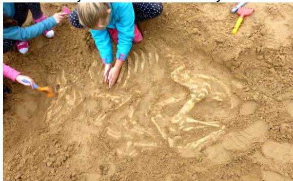
Archeologie na zámku Svijany

Ve středu 18. 10. 2017 se žáci 6. A zúčastnili vzdělávací exkurze do zámku Svijany. Přikládám článek paní učitelky Dany Štěpinové: Výlet z části dotoval Liberecký kraj, takže děti měly cestu a svačinu zdarma. Ve Svijanech absolvovaly exkurzi