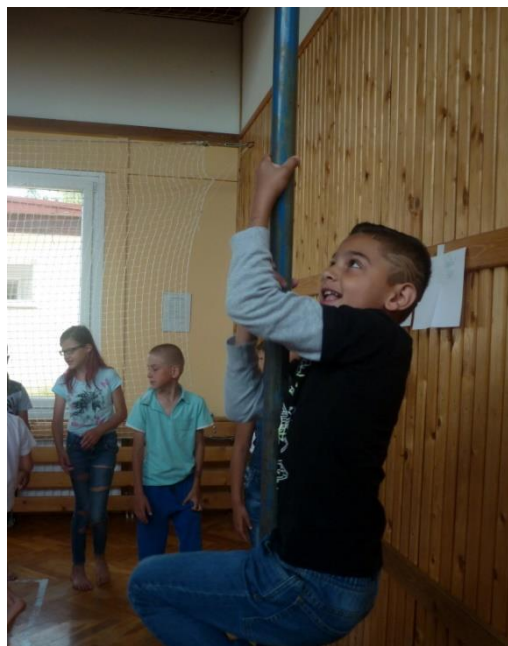
Šplháme na Sněžku

V květnu 2018 se již potřetí mohly děti z prvního stupně zapojit do sportovní