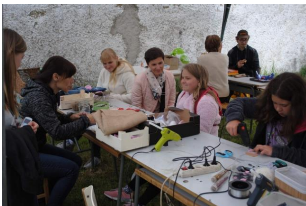
Raspenavské tvořivé hrátky