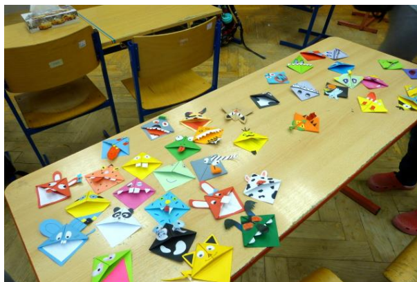
Záložka spojuje děti

18. října 2017 se za příznivých povětrnostních podmínek konala další Drakiáda. Tu pravidelně na podzim organizují paní učitelky z 1. stupně základní