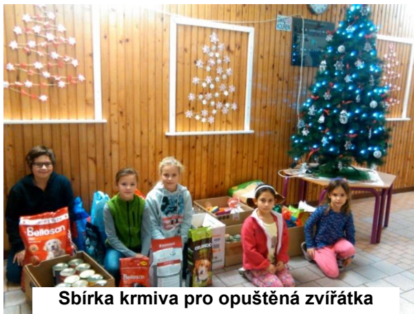
Sbírka krmiva pro opuštěná zvířátka