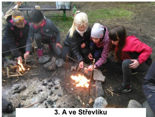
3. A ve Střevlíku

V úterý 14. května jsme se s třetí třídou vydali do Hejnic do Střevlíku na program Lovci mamutů I. Děti měly možnost vyzkoušet si chůzi milionovými kroky a poznávat tak různá časová období života dinosaurů a mamutů. Při hře na "velejeleny" musely spolupracovat a vymýšlet společnou taktiku, aby společně přežily a nenechaly se chytit šavlozubými tygry. Poté šly lovit mamuta střelbou z luku. Na závěr se pomocí křesadel snažily rozdělat oheň a vytvořily si tak možnost upéct si mamuta.