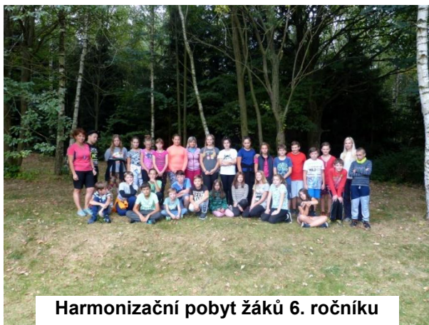
Harmonizační pobyt žáků 6. ročníku

Úterý: Ráno jsme zahájili den budíčkem v 7:30. Po ranní hygieně jsme posnídali a už nás čekaly první dopolední aktivity. Dnešní den jsme prožili v Bradavicích, kde jsme se potýkali s různými úkoly. Dvakrát jsme se potkali s Baziliškem. Poprvé jsme museli Harryho dostat do Tajemné komnaty a podruhé jsme se setkali přímo s hlavou Baziliška. Tyto hry byly velmi dramatické, ale Harry nakonec zvítězil. Následovalo vyluštění vzkazu, která dostal Harry od Brumbála. Protože byl napsaný starými runami, trvalo nám dlouhou dobu, než jsme ho vyluštili. Než jsme vyrazili na zasloužený oběd, museli jsme ještě překonat s Baziliškem naslepo cestu s různými překážkami. Po obědě a poledním klidu jsme si zahráli „Kolíčkovanou“ a „Bezrukou štafetu“. Všichni se snažili získat pro svůj tým co nejvíce bodů. Ještě před svačinou jsme se vydali do