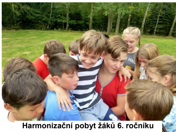
Harmonizační pobyt žáků 6. ročníku

Pondělí: Sešli jsme se v 9:30 u školy. Po odevzdání dokumentů a batohů jsme vyrazili na nádraží ČD v Raspenavě. Vlakem jsme odjeli do Hejnic, kde jsme strávili hodinku aktivitami na louce nedaleko od nádraží. Hráli jsme „Podávání míčku“, „Na harmonizák si vezmu...“ a