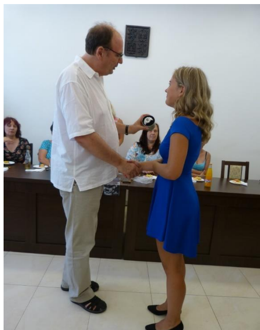
Rozloučení s deváťáky na MěÚ

pak je nástup jednotlivých tříd na podium, jejich představení, udělení pochval a drobných odměn. Jako poslední nastupují žáci 9. ročníku, se kterými se při této akci loučíme. Při vědomí, že naši deváťáci