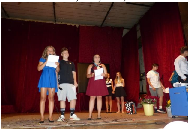
Ukončení školního roku v České besedě

27. června 2019 jsme uspořádali tradiční slavnostní ukončení školního roku v sále České besedy. Program vždy zajišťují žáci 8. ročníku. V rámci něj pak můžeme vidět nejrůznější scénky ze školního života, udělujeme tituly Osobnost školy, rozdáváme „placky“, které pro nás obstarává náš zřizovatel a odměny za výsledky sběru. Vrcholem programu pak je nástup jednotlivých tříd na