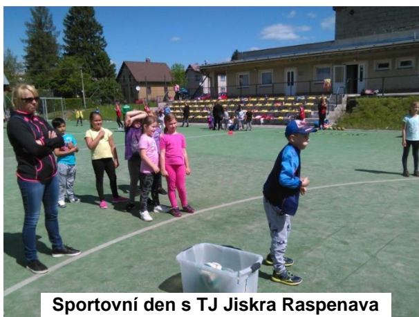
Sportovní den s TJ Jiskra Raspenava