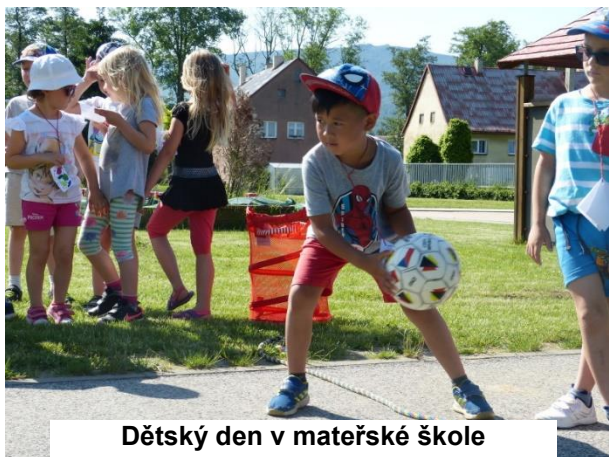
Dětský den v mateřské škole

složí čtenářský slib, je zde již připraven opravdový rytíř, který je pak jednoho po druhém pasuje na čtenáře. Akce je moc hezká a žáci si s sebou odnášejí kromě zážitků ještě pamětní list, „placku“ a pěknou knížku na čtení. Děkujeme všem organizátorům.