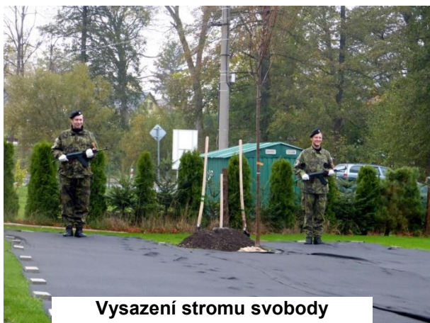
Vysazení stromu svobody

Na konci října také proběhla tradiční soutěž Přírodovědný klokan. V rámci této soutěže si mohou žáci ověřit své vědomosti a znalosti z matematiky, fyziky, přírodopisu a