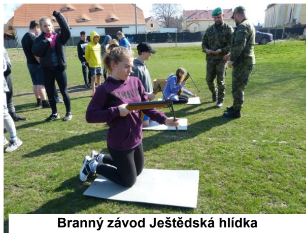
Branný závod Ještědská hlídka