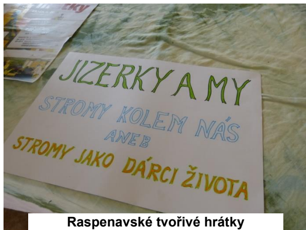
Raspenavské tvořivé hrátky

Raspenavské tvořivé hrátky se tradičně odehrávají v měsíci květnu v krásných prostorách raspenavské fary a rozkvetlé farní zahrady. Příprava takovéto akce je velmi náročná. Cílem všech organizátorů a zapojených dobrovolníků je zajistit v časovém předstihu vše potřebné, ke zdárnému průběhu akce. Vymyslet a připravit výtvarné dílničky pro děti i dospělé, k oživení příjemné atmosféry společného tvoření přizvat známé výtvarníky, malé i velké hudebníky, tanečníky a herce, zajistit příjemné zázemí pro všechny účastníky a návštěvníky atd.