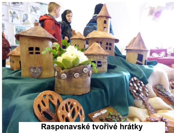
Raspenavské tvořivé hrátky