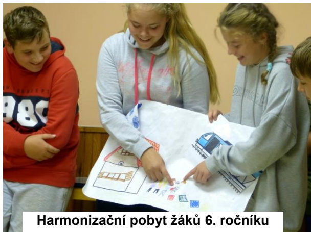
Harmonizační pobyt žáků 6. ročníku

Zakázaného lesa. Cestou jsme byli sledováni očima, o kterých jsme nevěděli, komu patří. Abychom přežili cestu, museli jsme rozeznat co nejvíce očí. Po svačině jsme si zopakovali listnaté a jehličnaté stromy, abychom mohli postoupit do dalšího ročníku. Večeře dnes byla sladká, měli jsme kynuté ovocné knedlíky. Byly moc dobré. Velmi povedená aktivita nás čekala po večeři, museli jsme zahřívát dračí vejce a neupustit ho na zem. Balónky naplněné vodou jsme museli předávat tak, aby nám nespady a nepraskaly. Někteří z nás byli pěkně zmáchaní. Tato aktivita se nám moc líbila. Než se nám zešeřilo, poznávali jsme pomocí čísel paní učitelky třídní. Naším úkolem bylo uhádnout informace, které byly skryté ve třech číslech. Den se