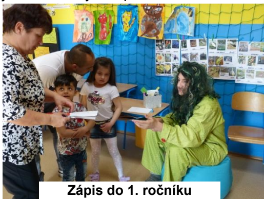
Zápis do 1. ročníku

V pondělí 8. dubna 2019 jsme od 16:00 hodin uspořádali zápis dětí k povinné školní docházce pro školní rok 2019/2020. Zápis pro naše budoucí prvňáčky jsme tentokrát pojali pohádkově. Na stanovištích s dětmi pracovaly pohádkové bytosti. Pomáhaly jim při řešení zábavných úkolů, samozřejmě pod dohledem paní učitelky a rodičů. Mohli jsme zde potkat klauna, vodníka, Křemílka a Vochoomůrku, princeznu, Ferdu mravence a ježibabu. Aby vše probíhalo hladce a děti se cítily co