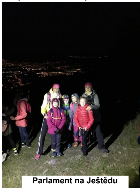
Parlament na Ještědu

Náš žákovský parlament vyrazil 19. září 2019 v rámci svého stmelování na večerní výlet na Ještěd. Byla to pro všechny úplně nová akce a všichni zúčastnění z ní měli spoustu zážitků, protože byli na Ještědu za tmy, viděli krásně zářící Liberec dole a zažili dobrodružství při nočním sestupu dolů.