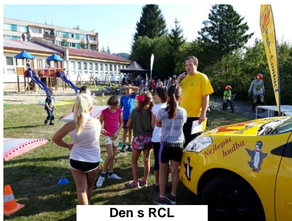
Den s RCL

První akce proběhla hned 5 září 2019. Jednalo se o den s Rádiem Contact Liberec. Redaktoři rádia si pro naše děti připravili několik atrakcí – skákací hrad, překážkovou dráhu pro cyklisty, hry a soutěže. Akce se pak postupně zúčastnili žáci 1. stupně základní školy. Počasí vyšlo a pro nás bylo příjemné i to, že někteří z organizátorů jsou naši bývalí žáci.