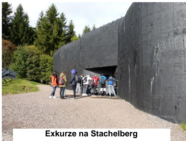
Exkurze na Stachelberg