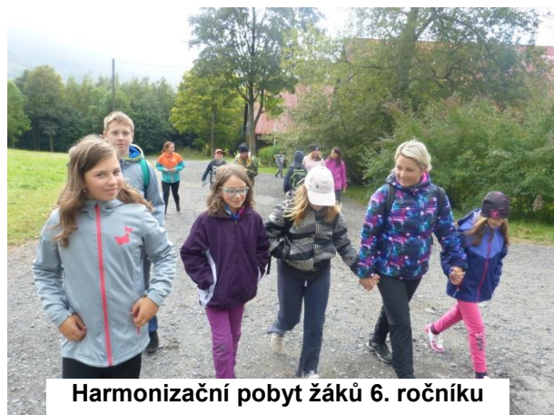
Harmonizační pobyt žáků 6. ročníku

V týdnu od 23. do 27. září 2019 se naši šestáci podruhé přesunuli areálu Rekreačního zařízení Jizerky v Bílém Potoce, aby zde absolvovali harmonizační pobyt.