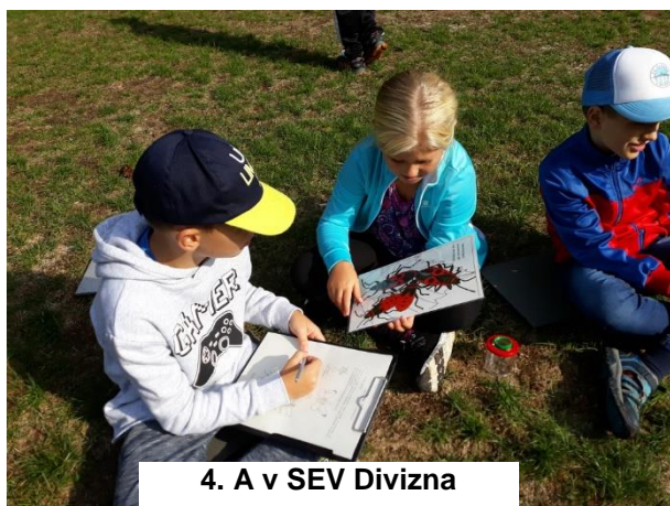
4. A v SEV Divizna

10. září 2019 vyrazila 4. třída do Střediska ekologické výchovy Divizna, aby se zde zúčastnila vzdělávacího programu o hmyzu. Program byl velmi zajímavý.