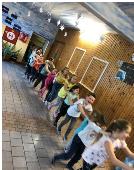
Pololetní žákovská diskotéka

A na závěr již tradičně děkuji našemu zřizovateli Městu Raspenava za podporu a pomoc při organizaci jarmarku a našim hasičům, kteří nám velmi pomohli s venkovním občerstvením. Díky nim jsme mohli návštěvníkům nabídnout i grilované bratwursty a maso. No a samozřejmě také děkuji všem návštěvníkům jarmarku za to, že přišli a vytvořili spolu s námi v prostorách školy tu správnou předvánoční atmosféru. Šťastné a veselé Vánoce všem!