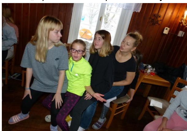
Harmonizační pobyt žakovského parlamentu