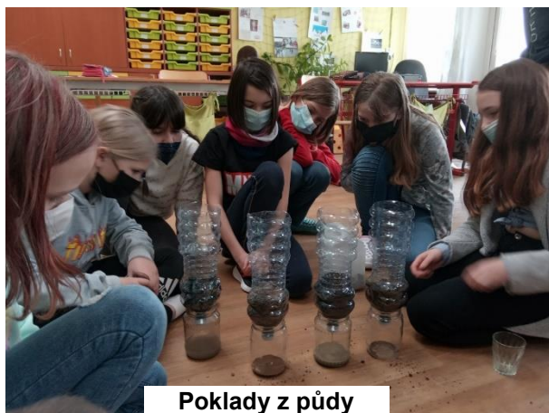
Poklady z půdy

Jak jsem zmiňoval již v úvodu, zhruba tři týdny po skončení harmonizačního pobytu došlo postupně k plošnému uzavření škol. V rámci opatření proti šíření onemocnění Covid-19 byly zakázány nebo výrazně omezeny školní i mimoškolní akce. Proto se některé akce mohly uskutečnit až při uvolňování opatření na jaře 2021.