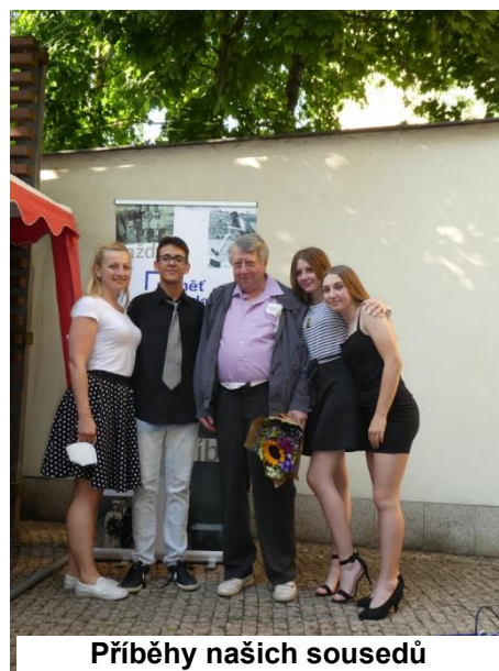
Příběhy našich sousedů