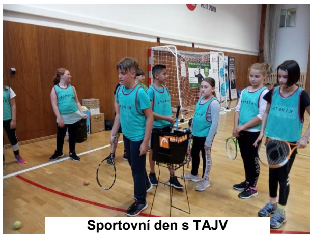
Sportovní den s TAJV

Poslední akcí v tomto školním roce byl Sportovní den s TAJV (Tenisová akademie Jan Váňa). Jedná se o sportovní den zaměřený na rozvoj sportovních schopností a dovedností