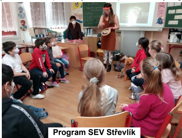
Program SEV Střevlík