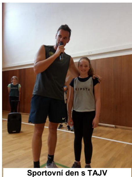
Sportovní den s TAJV

dětí, utváření přátelských vztahů mezi dětmi, podporu sportovního ducha a motivaci dětí ke sportu, pohybu a soutěžení. Tento sportovní den se uskutečnil 24. června 2021 ve sportovní hale v Raspenavě pod záštitou Města Raspenava a byl určen pro žáky 3. – 5. ročníku základní školy. Každý z účastníků si mohl formou soutěže vyzkoušet několik sportovních aktivit a vítězové vyhráli pěkné ceny. Byla to přesně ta aktivita, kterou děti po delší odmlce, kdy se moc nespotovalo ani nechodilo ven, potřebovaly. Dětem i paním