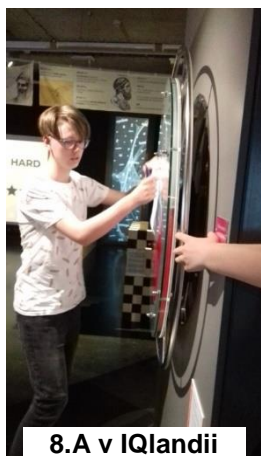
8.A v IQlandii

pytlí, vydali na předem stanovené trasy posbírat co nejvíce odpadků, které zde zanechali neukáznění turisté. Celkem 53 nasbíraných pytlů s odpadky nejrůznějšího druhu svezl městský úřad do sběrného dvora.“ Už se těšíme, že se zúčastníme i příští rok.