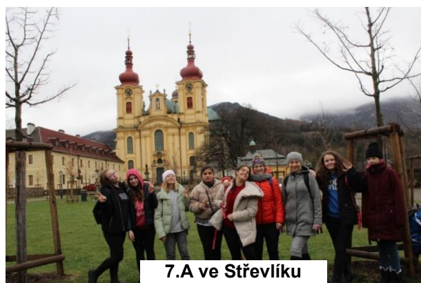
7.A ve Střevlíku

pozorování zvířat v přírodě. Na vycházce jsme však na žádné lesní zvíře nenarazili, a proto jsme byli vděční, že můžeme dalekohledem pozorovat alespoň koně a ovce ve vzdálené ohradě.“