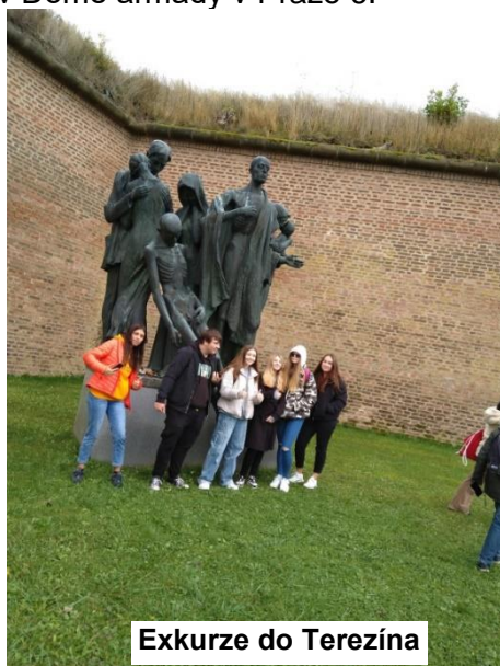
Exkurze do Terezína

30. září 2021 se paní učitelka dějepisu a asistent pedagoga zúčastnili konference Společnosti Ludvíka Svobody k 76. výročí osvobození Československa. Konference se konala v Domě armády v Praze 6.