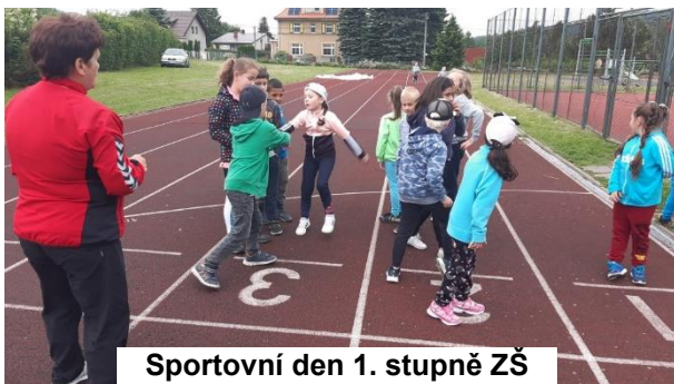
Sportovní den 1. stupně ZŠ