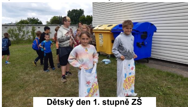
Dětský den 1. stupně ZŠ

Cituji článek paní učitelky Blanky Novotné „Za velmi příznivého počasí se v úterý 14.6.2022 na I. stupni ZŠ uskutečnil „Dětský sportovní den“. Děti byly