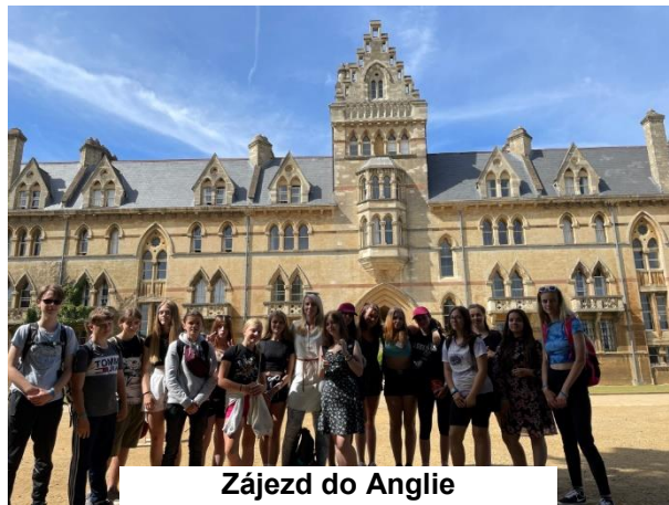
Zájezd do Anglie