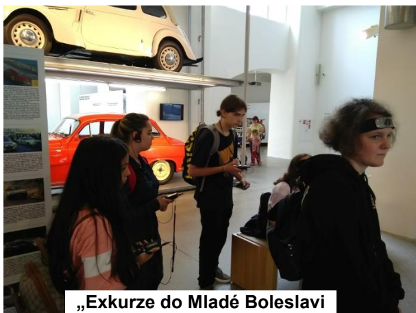
„Exkurze do Mladé Boleslavi

obory. Spousta žáků se pro zdejší nabídku nadchla. Poté se přesunuli do Muzea Škoda Auto. Zde jim průvodkyně poskytla výklad o jednotlivých typech aut, které se v rámci značky od založení závodu až do současnosti vyráběly. Děti se neplánovaně staly svědky výměny veteránských aut v expozici, mohly očichat kouř staré Škody 1000 MB a slyšet zvuk jejího motoru. (cituji článek paní učitelky Štěpinové)