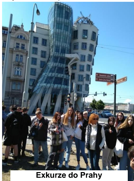
Exkurze do Prahy

V úterý 31. května 2022 jeli žáci 9. A a 9. B do Prahy. Děti začaly své poznávání hlavního města u Tančícího domu, poté se přesunuly ke kostelu sv. Cyrila a Metoděje – památníku Heydrichiády, následovala prohlídka Národního divadla. Poté se všichni velmi namáhavě vyškrábali na Petřín. Někteří si dokonce zaplatili vstup na samotnou rozhlednu. Pak už následoval jen pozvolný sestup z kopce dolů přes Pražský hrad, Nerudovu ulici, Karlův most, Staroměstské náměstí s orlojem až na Václavské náměstí k památníku Jana Palacha. Celkem jejich nožičky ušly zhruba 15 km. Počasí však přálo a děti byly sice utahané, ale spokojené.