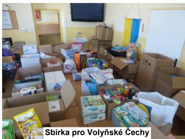
Sbírka pro Volyňské Čechy