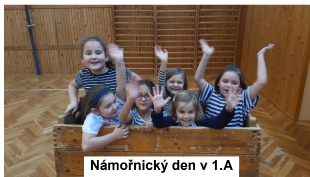
Námořnický den v 1.A